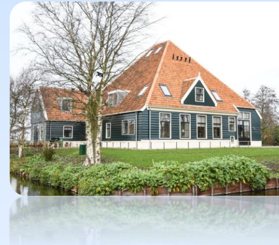
Het Buitenhuis in Wijdewormer